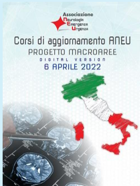
GRAFICO GENERALE CORSO DI AGGIORNAMENTO ANEU - PROGETTO MACRO AREE